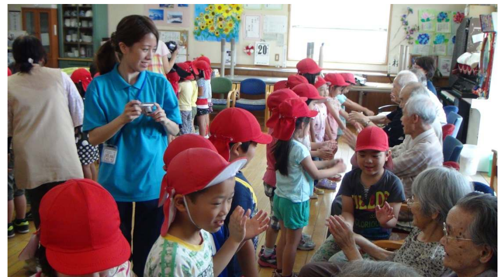
ゆり組(5歳児)が施設訪問をしました(6月20日)